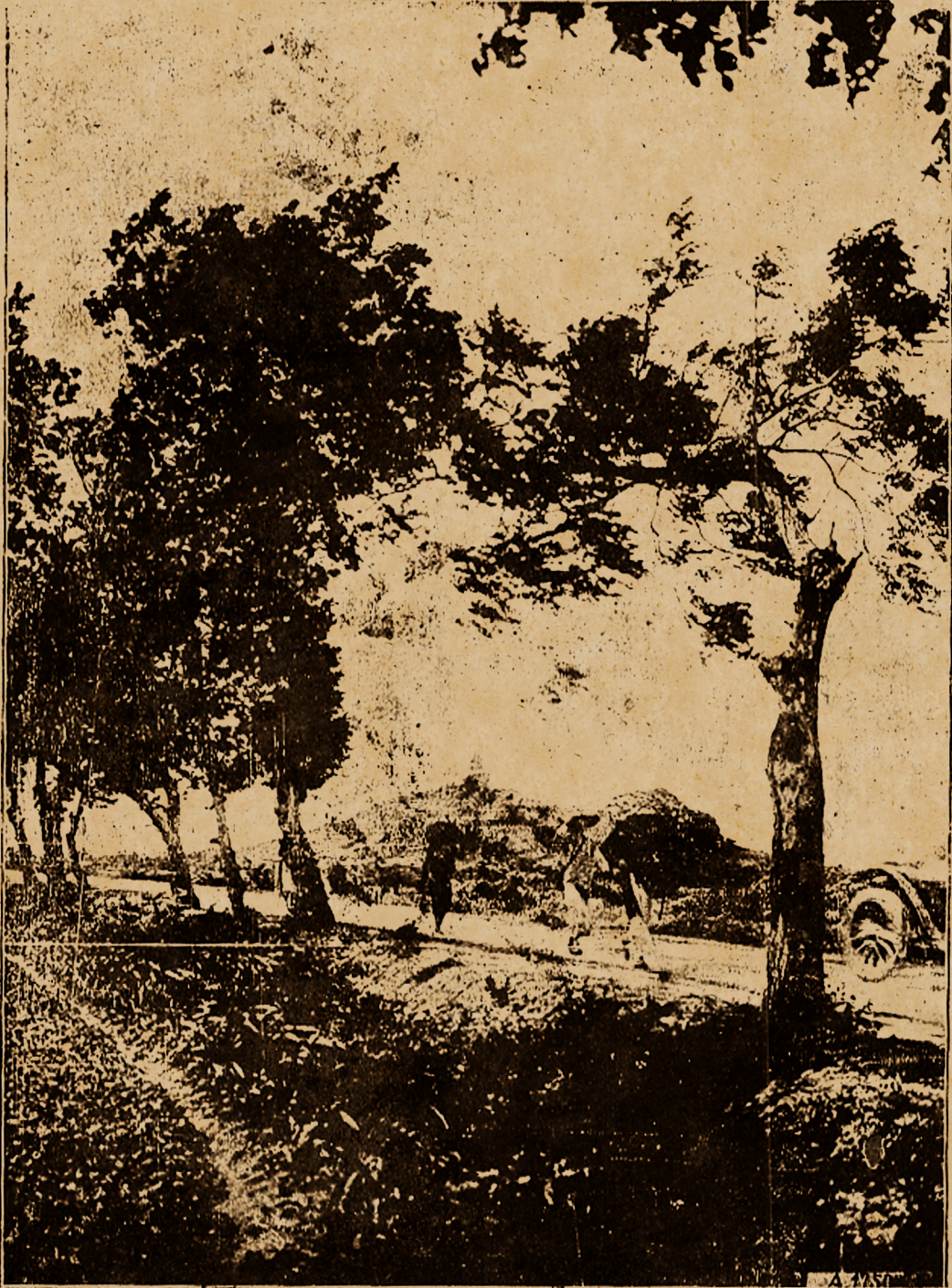
Đường từ Quảng-ngãi đi Qui-nhơn trên đồi có cái tháp Hời