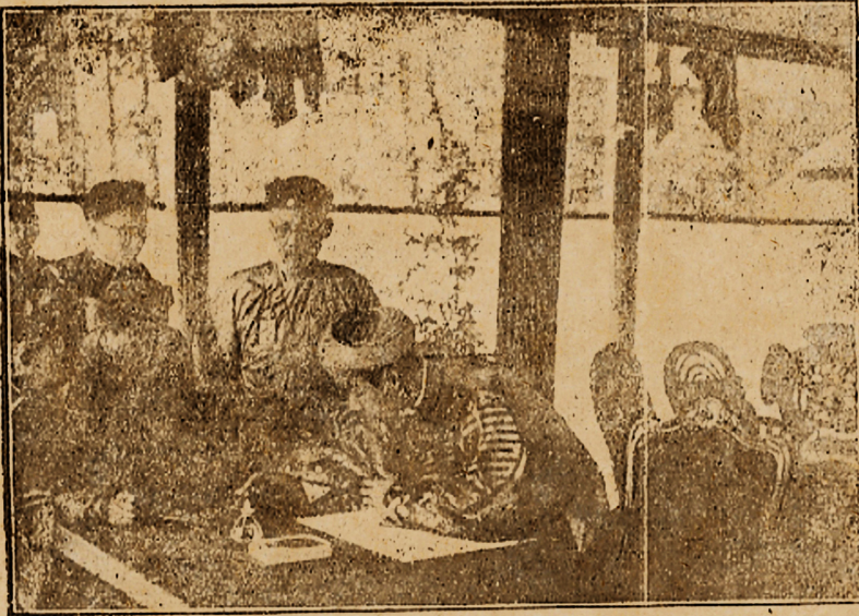
Lễ Nam-giao : Hoàng-Thượng dương tự điển Ngự-danh vào văn tế Trời.